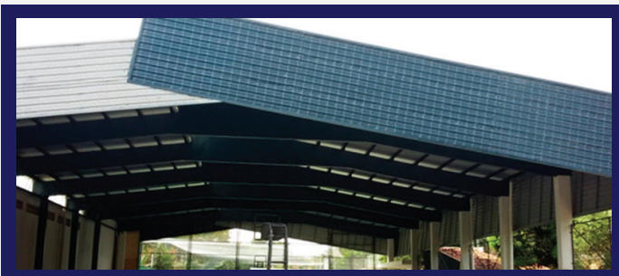
POLIDEPORTIVO DEL COLEGIO AULA VIVA (ASUNCIÓN)

Las vigas de este polideportivo están totalmente forradas en chapa para evitar nidos de aves o acumulaciones que suelen formarse.