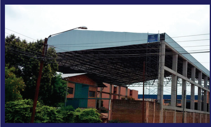
POLIDEPORTIVO DEL COLEGIO PIEDAD

Estructuras fabricadas con perfiles de chapa doblada. Los cálculos se elaboran basados en normativas de seguridad contra vientos.