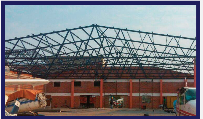
HANGAR AIRPAR SERVICE (ZONA DEL AEROPUERTO)